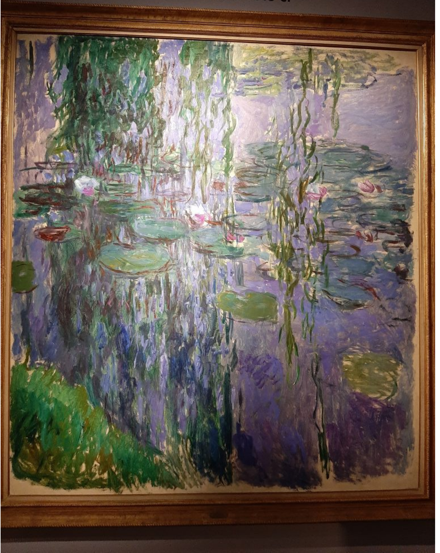
Claude Monet Ninfee 1916-1919 c.